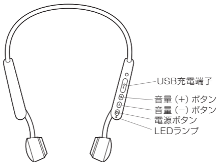
マルチファンクション ボタン